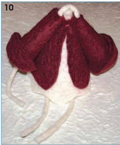
10 - Incollare le braccia così vestite in cima al corpo.