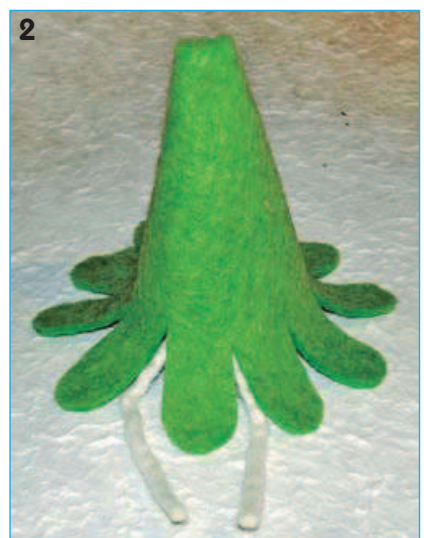
2 - Chiudere a cono la sottoveste sovrapponendo i due profili laterali con un filo di colla a caldo.