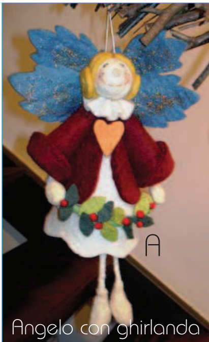
Angelo con ghirlanda