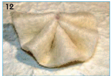
12 - Tirare le estremità del filo, arricciare ed annodare. Incollare il colletto sul cono.