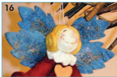
16 - Applicare le ali dietro la testa dopo avervi nascosto il nodo del cordoncino che servirà per sospendere l'angioletto.