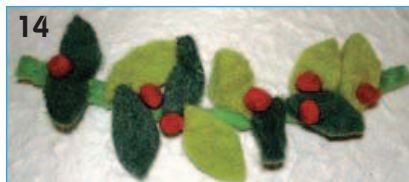
14 - Preparare la ghirlanda: ritagliare una decina di foglioline nei ritagli di feltro verde ed applicarle lungo il filo di feltro verde vivo. Dal filo di feltro rosso ricavare dischetti che, incollati sul ramo, rappresenteranno le bacche.