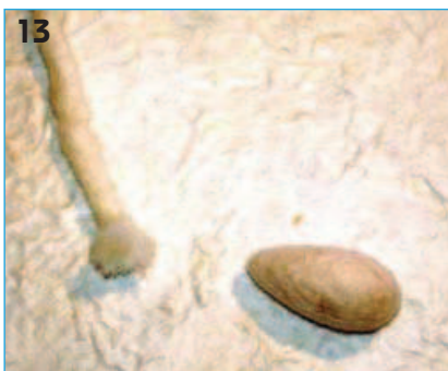
13 - Per applicare mani e piedi, allargare le fibre all'estremità del filo ed usare un goccio di colla a caldo.