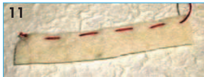
11 - Tagliare una fascetta di feltro bianco di 1,5x14 cm e fare un punto filza lungo il bordo.