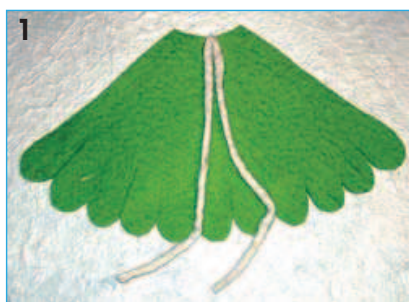
1 - Tagliare nel feltro verde la sottoveste. Fissare a questa, in corrispondenza del centro del profilo del collo, con colla a caldo o con due punti ad ago, 35 cm di filo panna ripiegato a metà.