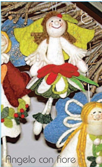
Angelo con fiore